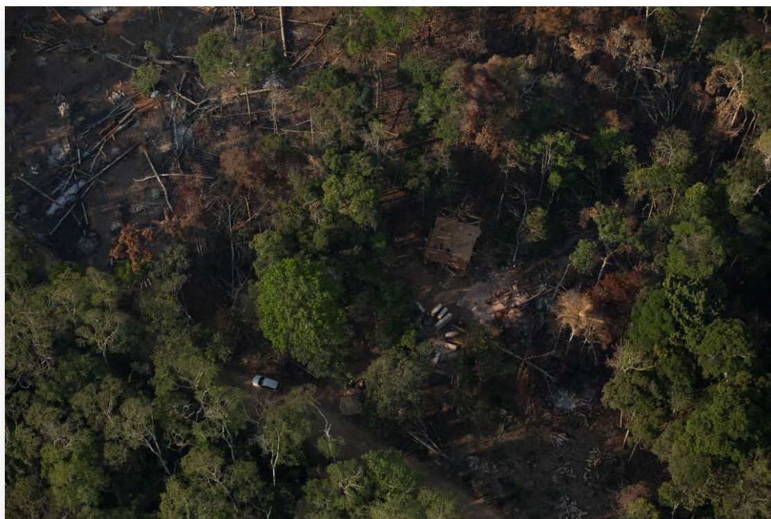
Área de floresta derrubada em Porto Velho, RO.