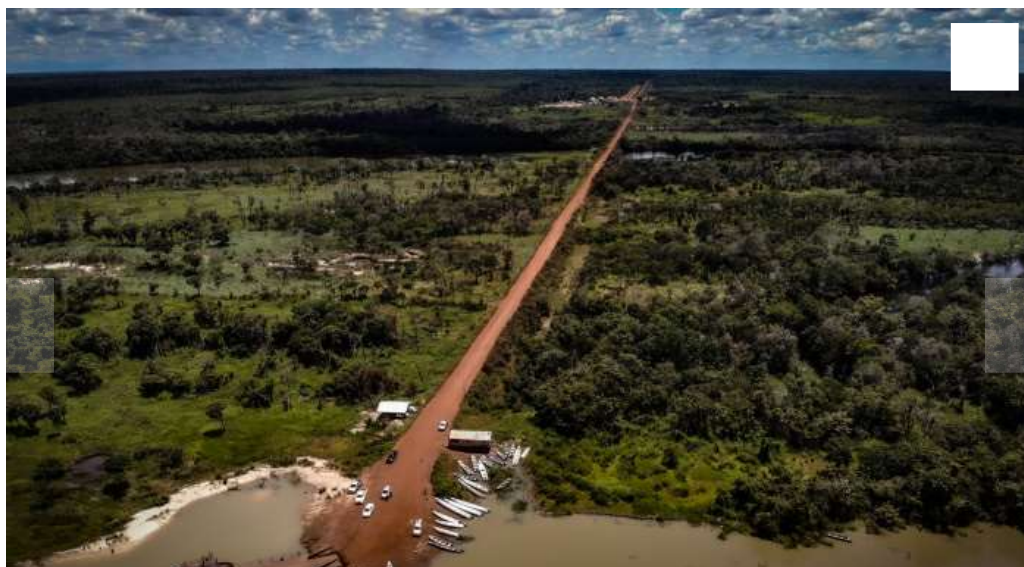
Balsa na Terra Indígena Capoto-Jarina | Todd Southgate