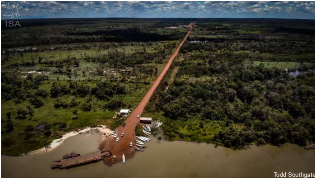
Balsa na Terra Indígena Capoto-Jarina

Mato Grosso. Mais da metade desse desmatamento ocorreria somente no Território Indígena do Xingu. A perda de floresta dentro da bacia logística da Ferrogrão no Mato Grosso atingiria 65% até 2035. Nos últimos 10 anos, o desmatamento no Corredor Xingu foi de 0,48% enquanto no entorno os números chegaram a 7,79% (Rede Xingu+).