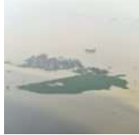
Hai hướng tiếp cận Rào Trăng