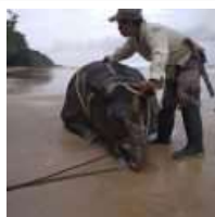
Tê giác Java như đang sống