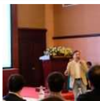
Quản lý rừng phòng hộ và