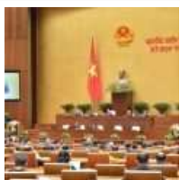
Quốc hội thảo luận về kinh tế