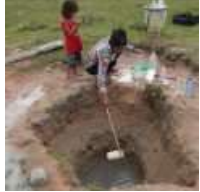
Nguy cơ cạn kiệt và ô nhiễm