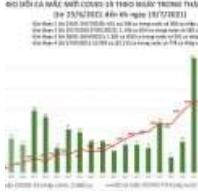
Sáng 19/7: Có 2.015 ca mắc