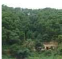
Người trồng rừng lao đao