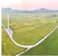
Đón gió: Cơ hội năng lượng tái