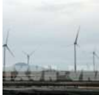
Năng lượng tái tạo: Đốt nhà để