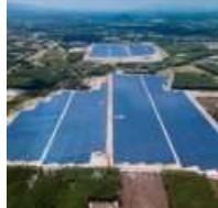
Những vấn đề đặt ra khi đầu