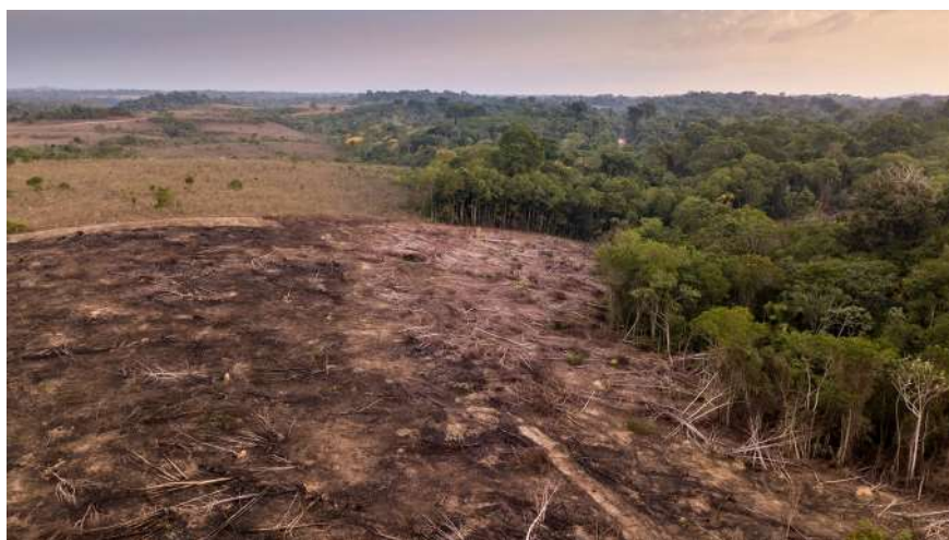
Cây cối bị chặt và đốt để mở đất nông nghiệp và chăn nuôi trong rừng quốc gia Jamanxim, Para, Brazil.

Mặt trái của ngành chăn nuôi bò vùng Amazon