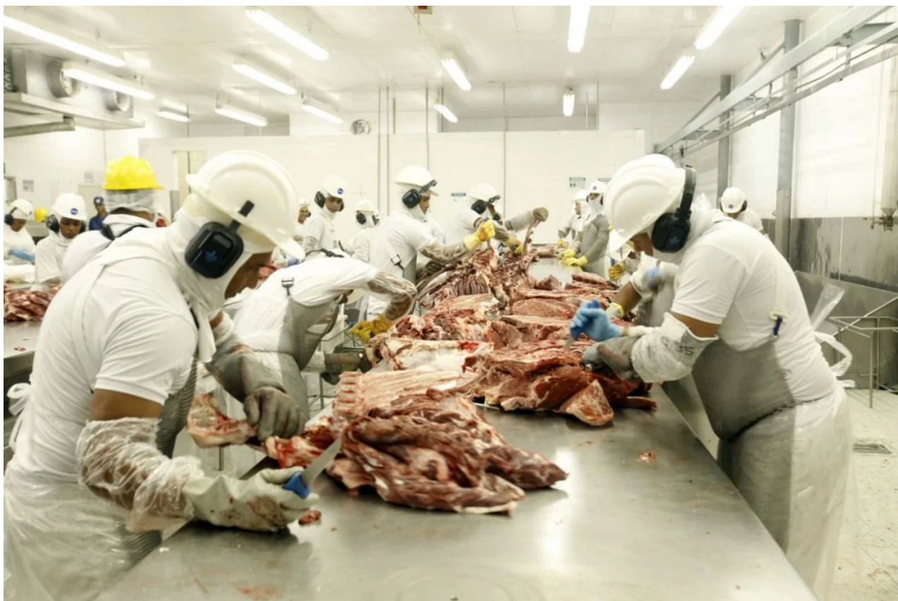
Exportação de carne aumentou de 5% da produção em 2000 para 26% em 2019, diz estudo

“A pecuária é uma atividade fácil para domar a terra, pois o gado pode ser criado em áreas com baixa infraestrutura, o que facilita a especulação [imobiliária]”, explica Barreto.