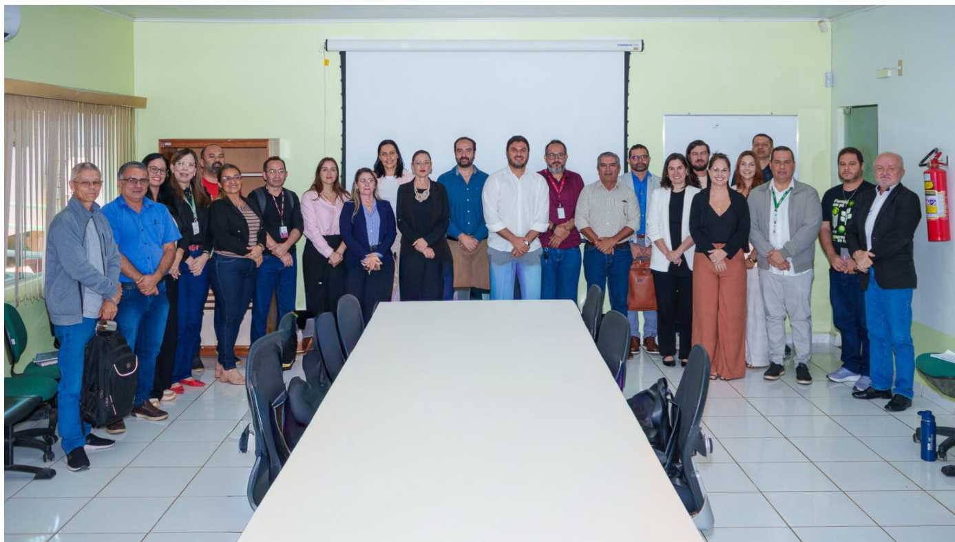
Governo avança na transparência ambiental com lançamento da Plataforma Selo Verde no Fórum Empresarial do Acre.

O trabalho conjunto permite gerar diagnósticos confiáveis e reúne dados ambientais, fundiários, socioeconômicos e imagens de satélite de alta resolução.