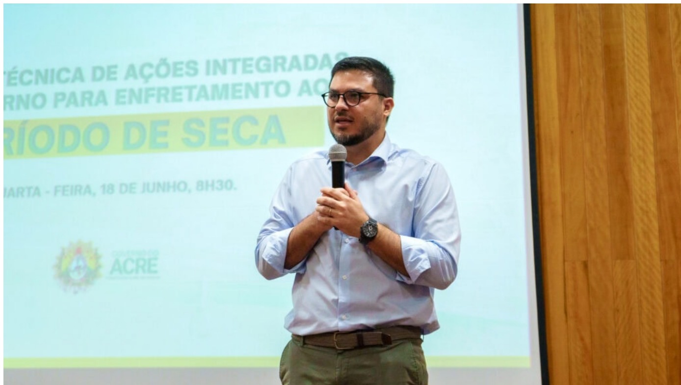
Secretário do Meio Ambiente, Leonardo Carvalho, ressalta a importância da ferramenta.

“É um grande passo que estamos dando. Sabemos que o desenvolvimento não é um atrapalho para conservação ambiental e vice-versa. São ações que andam em conjunto e a gente precisa cada vez mais fomentar o desenvolvimento sustentável para que o Estado continue nesse caminho de desenvolvimento, mas também respeitando as normas ambientais.”